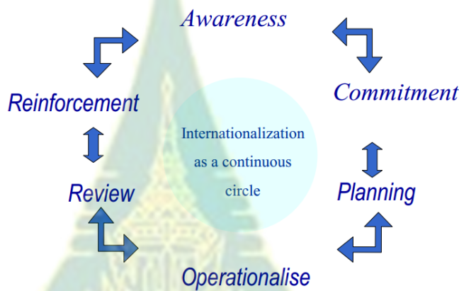
ภาพที่ 4.1 ความเป็นสากลในแง่กระบวนการ

ไนท์ (Knight, 1994) ยังได้นำเสนอความเป็นสากลในแง่วงจร (internationalization as a continuous cycle) ประกอบด้วย 6 ขั้นตอน ได้แก่ 1) ความตระหนัก ในเรื่องความจำเป็น ผลดีของความเป็นสากลในกลุ่มผู้เกี่ยวข้อง ทั้งฝ่ายบริหาร อาจารย์ นักศึกษา บุคลากรและสังคม ) 2) ความรับผิดชอบหรือพันธสัญญา ของทุกฝ่ายที่เกี่ยวข้องทุกระดับ 3) การวางแผน ระบุความจำเป็น ความต้องการ ทรัพยากร วัตถุประสงค์ ความคาดหวัง การจัดลำดับและกลยุทธ์ 4) ดำเนินการ กิจกรรมและบริการทางวิชาการ ปัจจัยขององค์กร ใช้หลักการนำ 5) ทบทวน ประเมินและส่งเสริมคุณภาพและผลกระทบของการริเริ่มและการพัฒนากลยุทธ์ 6) การสนับสนุน พัฒนาแรงจูงใจ ความตระหนักและการมีส่วนร่วมของทุกฝ่ายที่เกี่ยวข้อง ดังภาพที่ 4.1